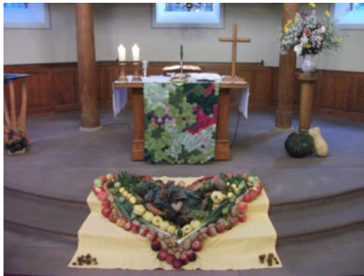
Liebevoll dekoriertes Altar in Ilbesheim.