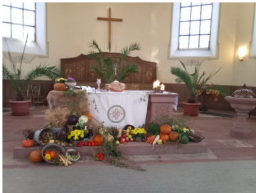
Festlich geschmückter Altar in Mörzheim.

Auch dieses Jahr haben sich alle vier Kirchengemeinden mit der Dekoration des Erntedankgottesdienstes sehr viel Mühe gegeben und somit ein ansprechendes Ambiente geschaffen. Allen helfenden Händen ein ganz herzliches Dankeschön.